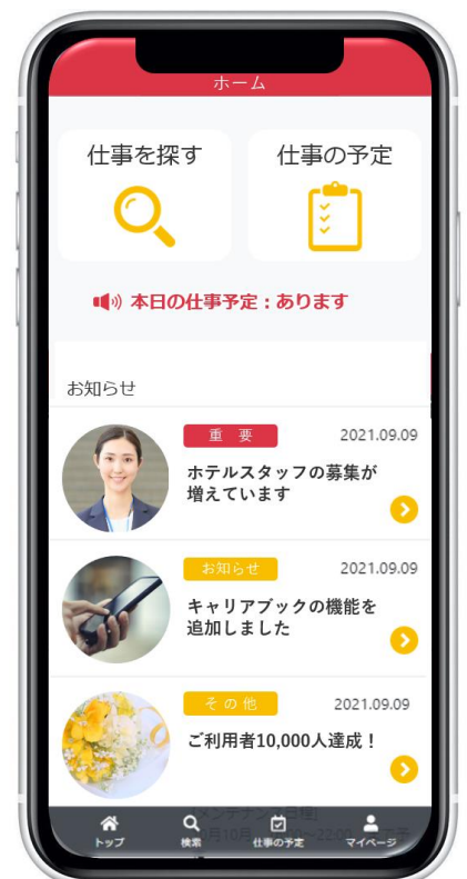
アプリイメージ（利用者側）

新規事業の立ち上げ経験・ システム開発経験の豊富な 京なかGOZANにお任せください！