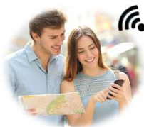
発信器に 近づいたら Push通知